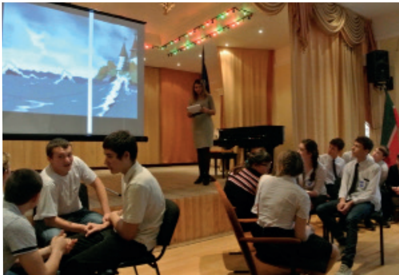
На фото: студенты колледжа обсуждают задание.

Всем участникам и победителям были вручены дипломы и памятные сувениры. А завершилась игра выступлением квнщиков колледжа «Пилигрим», которые катком юмора прошли по злободневным для молодежи темам дня.